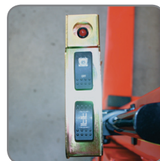
Vom Anwender zum Heben und Senken einzustellen.