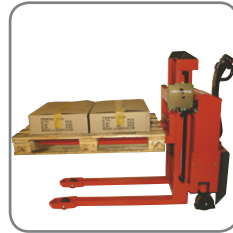
Lässt sich rechts und links montieren, sowie einfach nachrüsten.