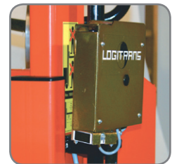
Sensor mit einstellbarer Zeitverzögerung: 1-10 Sek.

Gerne bieten wir Ihnen auch kundenspezifische Lösungen an.