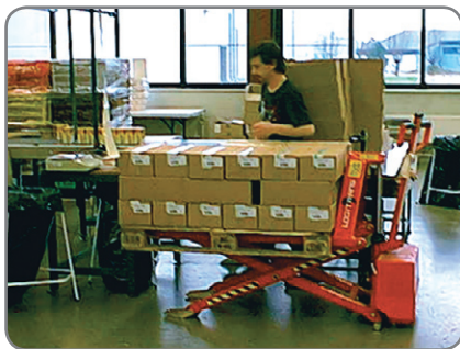
Kann an die Elektro-Scherenhubwagen und Logiflex-Stapler (ohne Teleskopmast) angebaut werden.