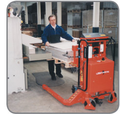
Das Gerät lässt sich auch wie ein gewöhnlicher Hubwagen einsetzen.