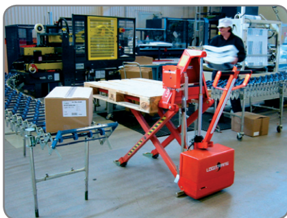
Die einstellbare Arbeitshöhe beträgt 490 - 970 mm beim Scherenhubwagen und 550 - 920 mm beim Logiflex.