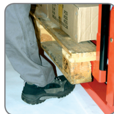
Sicherheit vor Quetschungen (gemäß EN 349:1993).