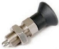
Sicherungsstift M16x1,5mm Artikel Nr M0001