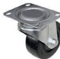
Lenkrolle für Adapter Schwarz Ø 125 mm Item number 338678