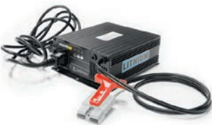
Ladegerät (extern) für Lithium Batterie, 25,6V / 10A Artikel Nr OPT0013