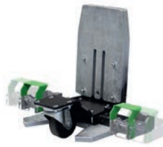
Adapter für Einkaufswagen Artikel Nr 339094