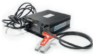
Ladegerät (extern) für Lithium Batterie, 25,6V / 10A Artikel Nr OPT0013