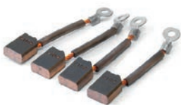
Kohlebürsten (4er Set) für Motor 300W Artikel Nr M0186