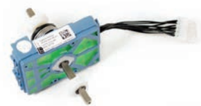
Schalter Deichselkopf ohne Tasten Artikel Nr M0121-FLIPPER