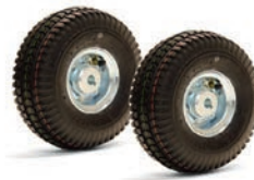
Treibräder Satz, geschäumt Schwarz 2x Ø 260 x 85mm Artikel Nr 335573