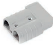
Steckergehäuse SB50 Artikel Nr M0105