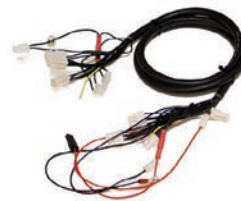
Kabelsatz für Curtis Artikel Nr 335406