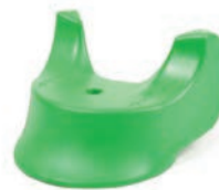
Flügelschalter (2) grün Artikel Nr M0121-KNOP-GROEN