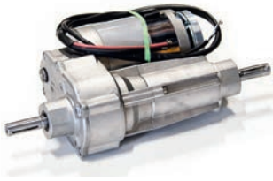
Antrieb 300W / 100UpM mit Bremse Artikel Nr M1033