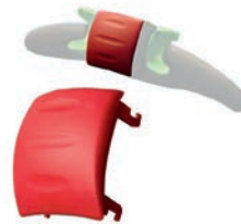
Belly button ROT Artikel Nr M0121-BBUT