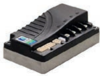
Curtis Antriebsregler DC 24V, Inom 30A, I max 50A Artikel Nr M3161