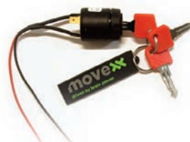
Zündschloss (gleichschliessend) Artikel Nr 337182