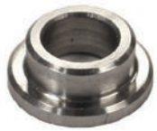
Gleitlager Ø8 / 12 x 6, 16 x 2 mm Artikel Nr M4038