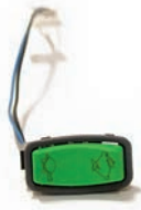
Schalter FAST/SLOW Deichselkopf grün Artikel Nr M0121-SPEED-GROEN