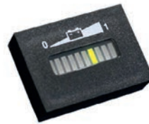
LED Batterieanzeige Artikel Nr M3165