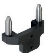
Leitstift Batterie Artikel Nr 339032