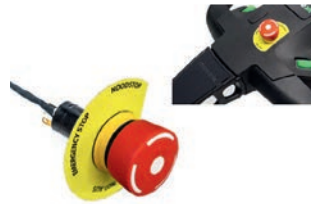
Not-Aus Artikel Nr 335601