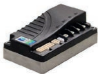
Curtis Antriebsregler DC 24V, Inom 30A, I max 50A Artikel Nr M3161