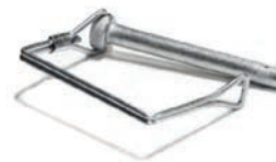
Verriegelungsstift Artikel Nr M0037