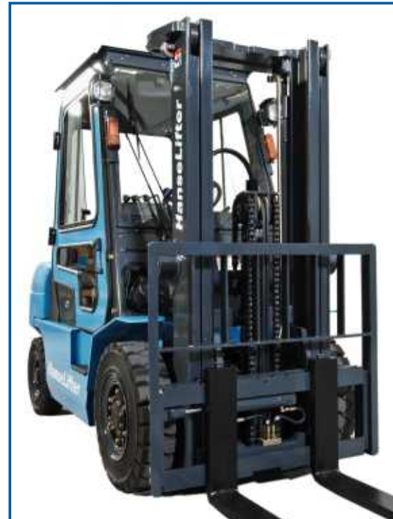
Hochwertige Duplex-, oder Triplex-Masten in verschiedenen Hubhöhen.

Durch die hochwertigen Mastprofile haben die Stapler auch in großen Hubhöhen noch sehr gute Resttragfähigkeiten. Die Gabellängen können Sie zwischen 1000 - 2400mm wählen. In der Serienausstattung sind 1200mm Gabeln enthalten.