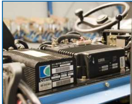
Hochwertige Duplex-, oder Triplex-Masten in verschiedenen Hubhöhen.

Die Wartung und Bedienung der Batterie erfolgt auf Grund der Bauform des Staplers unkompliziert und denkbar einfach. Die Batterie wird auf einem Schlitten komplett aus dem Chassis gezogen und ist so frei zugänglich. Je nach Ausführung werden die