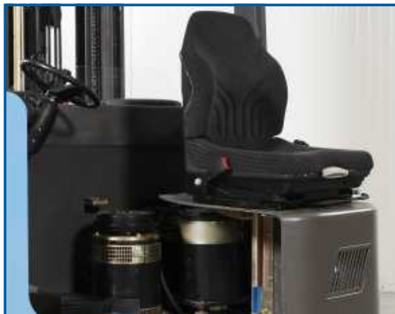
Komfortfahrersitze sind bei den Gabelstaplern von HanseLifter Serienausstattung.

Für Arbeiten an der Hydraulik und am Antrieb kann der Fahrerplatz komplett zur Seite geschoben werden und schafft Bewegungsspielraum zum Arbeiten.