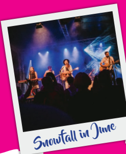
Snowfall in June

Das Kleine Café (Johannisstraße 15) in der Hattinger Altstadt freut sich am Altstadt-wochenende auf Besucher, die Lust auf Live-Musik haben.